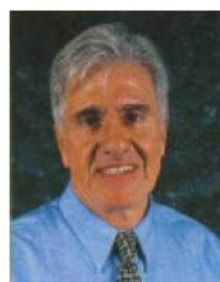
email: aascar@uol.com.br www.ascarassociados.com.br

Para você não se desesperar em 2009. "Por maior que seja o buraco em que você se encontre, pense que, por enquanto, ainda não há terra em cima." (autor desconhecido)